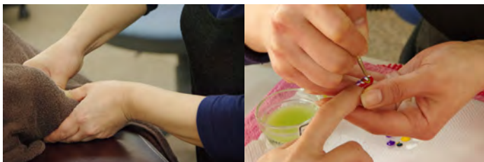
【リラクゼーション セラピストコース】

ご自身に適したお仕事を一緒に見つけていきます。 経験豊富な講師や職員のもとで専門性を高め、必要とされるスキルを身につけた人材へのサポートをしています。