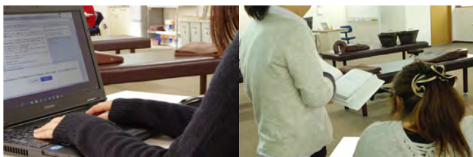
【PC / ITコース】